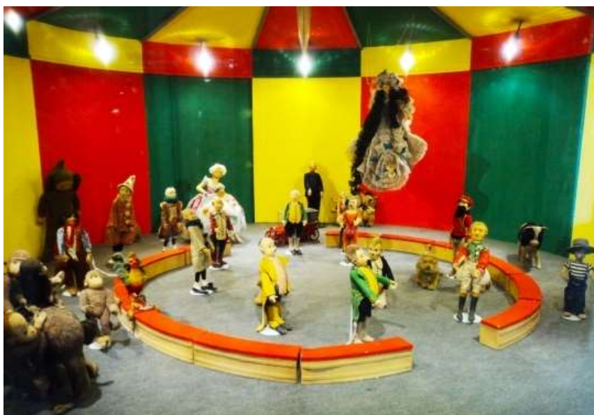
Circo Steiff Museo Casa Lis

El 11 y 18 de febrero se realizaron visitas guiadas al Museo Casa Lis enfocadas a nuestros socios juveniles.