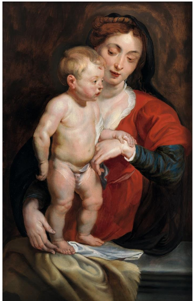
“ Virgen de Cumberland ”. Pedro Pablo Rubens. Óleo sobre tabla.

A través de esta exposición, se pueden apreciar en la Casa Lis los diferentes géneros que abordaron los artistas de la escuela flamenca entre los que destacan las obras de carácter religioso, mitológico, retratos , así como el paisaje característico del arte flamenco del siglo XVII, sobresaliendo, como era habitual en los artistas de Flandes , el juego de luces y sombras. Además, se ha otorgado gran importancia al bodegón o naturaleza muerta , género relegado a un papel secundario durante siglos, si bien con gran importancia a lo largo de la historia del arte y de la pintura flamenca. Así, destaca la pintura de flores , afición que se había despertado en Europa a finales del siglo XVI con la importación de flores exóticas de Oriente Próximo, Asia y América . Muchas de estas composiciones consistían en guirnaldas que decoraban escenas religiosas . Generalmente, las obras de este tipo eran regalos para los gobernantes y los representantes de la Iglesia. También podían decorar capillas privadas de la nobleza y destacadas sacristías de algunas órdenes religiosas. No debe olvidarse que algunas de las fuentes de inspiración principales para los artistas de Flandes eran el Antiguo y el Nuevo Testamento, especialmente el Génesis, el Apocalipsis y los escritos que narran la infancia de Cristo y la Pasión.