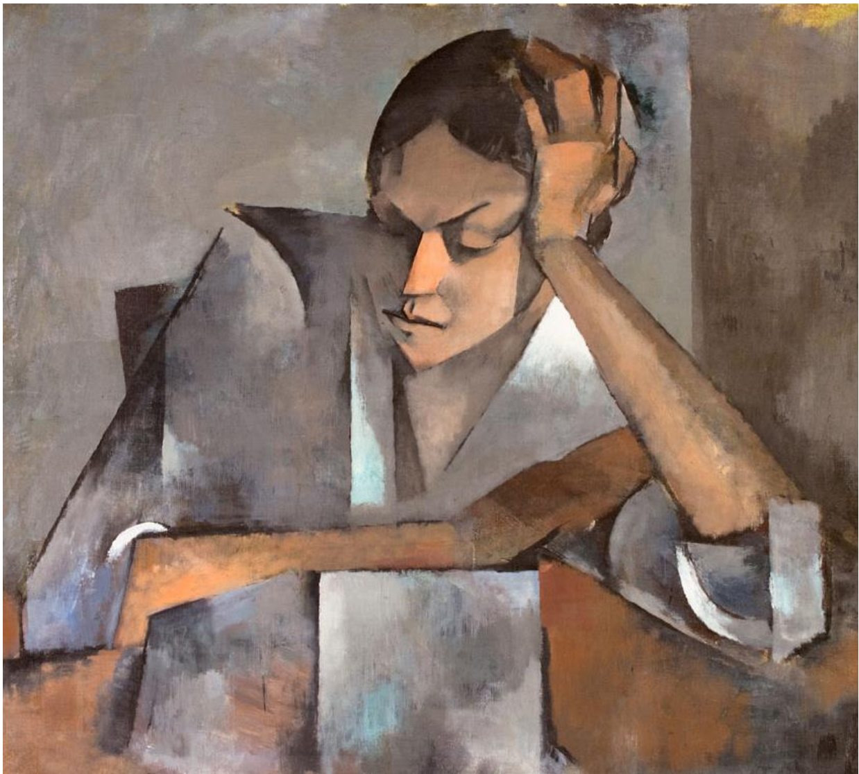
“Mujer acodada en mesa”. Olga Sacharoff. Óleo sobre lienzo. 72 x 80 cm. C. 1915.

Además, el Museo Casa Lis realizará varios juegos de pistas denominados #LaPartePorElTodo en los que mostrará detalles de varias de sus obras en sus perfiles de redes sociales con el objetivo de que sus seguidores adivinen a qué obra de arte corresponden, obra sobre la que se compartirán contenidos relacionados con el Día Internacional de los Museos 2020 . De este modo, se proseguirá con la intensa actividad desarrollada virtualmente durante la semana previa, ya que entre el 11 y 17 de mayo la institución también ha participado en la #MuseumWeek compartiendo distintos contenidos en torno a una etiqueta diaria. Y todo ello se engarza en el conjunto de acciones culturales digital denominado #DeNuestraCasaATuCasa que comenzó a mediados de marzo para proseguir con la comunicación de contenidos artísticos y acciones participativas con el público .