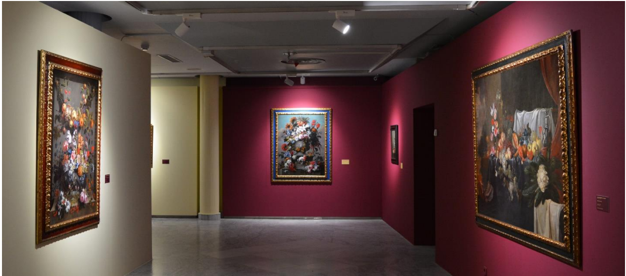
Fotografía de una sala de la exposición “De Rubens a Van Dyck. La pintura flamenca en la colección Gerstenmaier”.

A través de esta exposición, se pueden apreciar en la Casa Lis los diferentes géneros que abordaron los artistas de la escuela flamenca entre los que destacan las obras de carácter religioso, mitológico, retratos , así como el paisaje característico del arte flamenco del siglo XVII, sobresaliendo, como era habitual en los artistas de Flandes , el juego de luces y sombras. Además, se ha otorgado gran importancia al bodegón o naturaleza muerta , género relegado a un papel secundario durante siglos, si bien con gran importancia a lo largo de la historia del arte y de la pintura flamenca. Así, destaca la pintura de flores , afición que se había despertado en Europa a finales del siglo XVI con la importación de flores exóticas de Oriente Próximo, Asia y América . Muchas de estas composiciones consistían en guirnaldas que decoraban escenas religiosas . Generalmente, las obras de este tipo eran regalos para los gobernantes y los representantes de la Iglesia. También podían decorar capillas privadas de la nobleza y destacadas sacristías de algunas órdenes religiosas. No debe olvidarse que algunas de las fuentes de inspiración principales para los artistas de Flandes eran el Antiguo y el Nuevo Testamento, especialmente el Génesis, el Apocalipsis y los escritos que narran la infancia de Cristo y la Pasión.