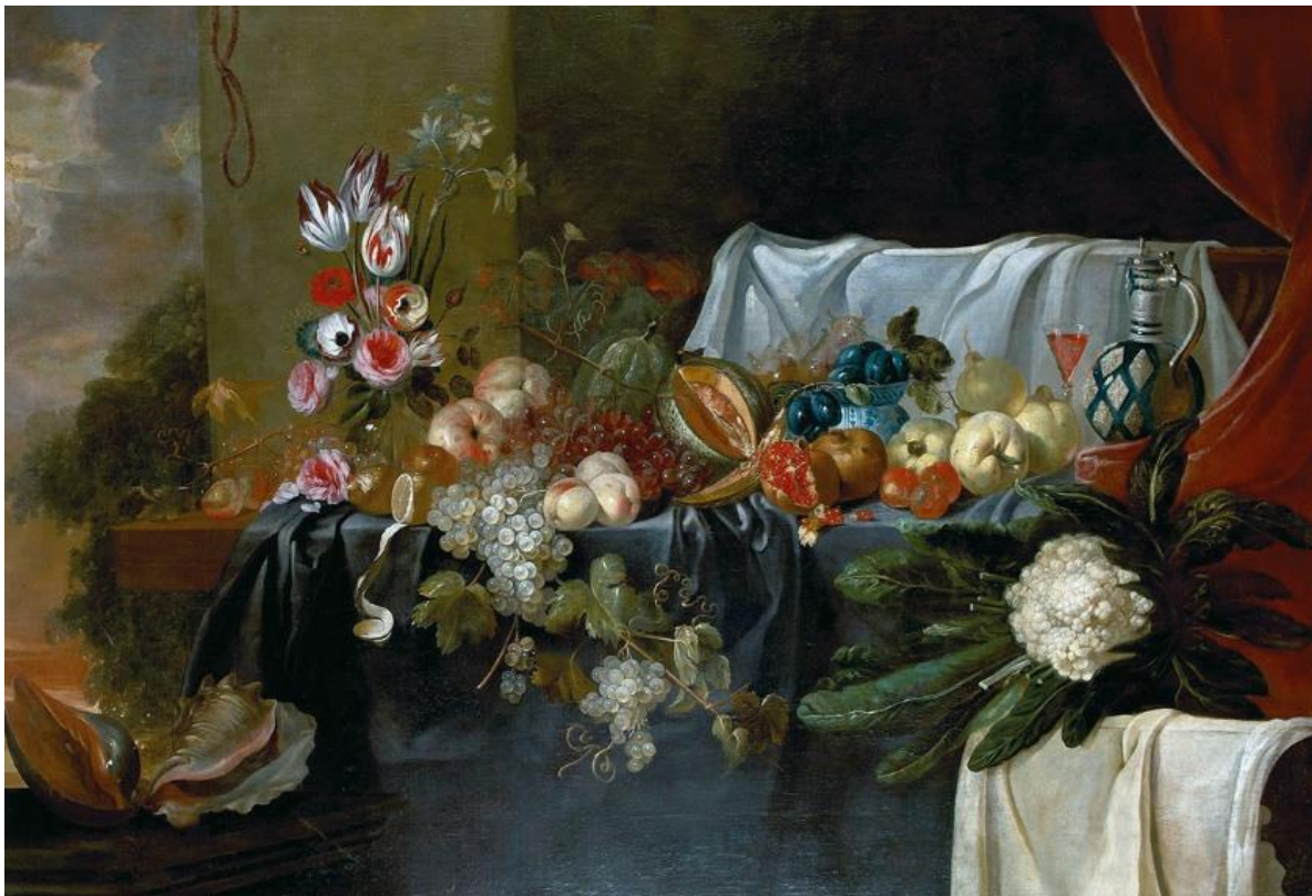
"Naturaleza muerta". Jan van Kessel "El Viejo". Óleo sobre lienzo.