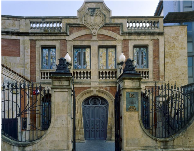
Fachada Norte de la Casa Lis por la que se accede al Museo.

0. A estas medidas de seguridad e higiene se suma la prioridad en el acceso para mayores de 65 años establecida por el Museo en la franja de 11 a 12 horas de la mañana , si bien también se facilitará su acceso rápido en el resto del horario de apertura de la institución si en alguna de las franjas horarias se produjeran esperas para acceder al edificio por parte del público, lo que se regulará en el exterior del edificio guardando cola con la debida distancia de seguridad entre quienes deseen visitar la Casa Lis .